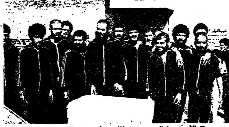
الشيخ مسلماني وعدد من الفرج عنهم من معتقل - عشتة -